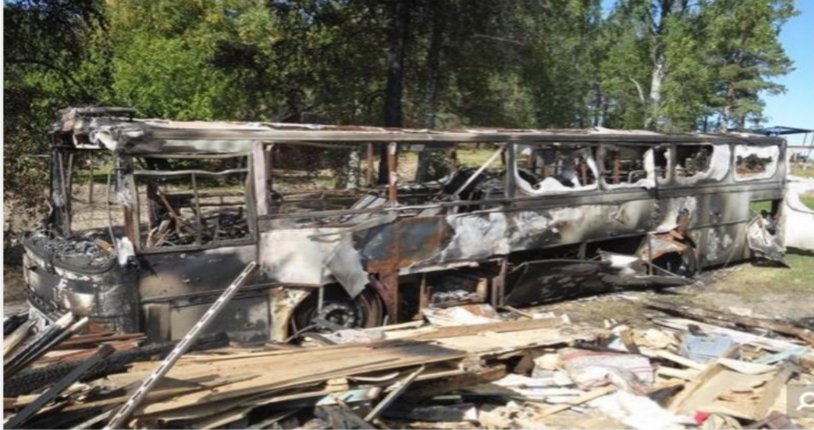
Poliisi epäilee yrittäjän polttaneen kuvassa olevan linja-auton.

Oikeus totesi, että Vuotovesi oli myös päästänyt ajoneuvoyhdistelmän valumaan ulos tieltä ilman kuljettajaa sekä aiheuttanut linja-auton tulipalon.